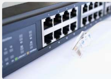
TRASMISSIONI DATI E NETWORKING