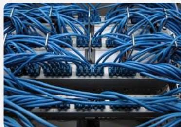
CABLAGGIO DI EDIFICI