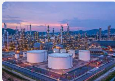
OIL & GAS